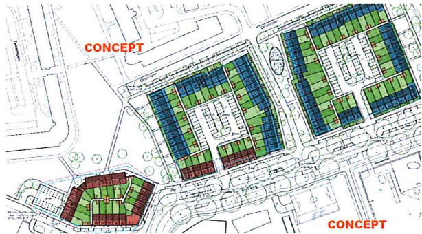
Opzet van de wijk

Op onderstaande kaart zijn in blauw de koopwoningen aangegeven (blok rechts en grootste deel blok midden) en in rood de huurwoningen (deel blok midden en blok links). In afwijking van eerdere plannen komen er geen appartementen maar alleen zogenaamde grondgebonden woningen, met uitzondering van twee maisonnette woningen. Parkeren kan straks op de binnenterreinen en op nieuw aan te leggen parkeerplaatsen buiten de woonblokken.